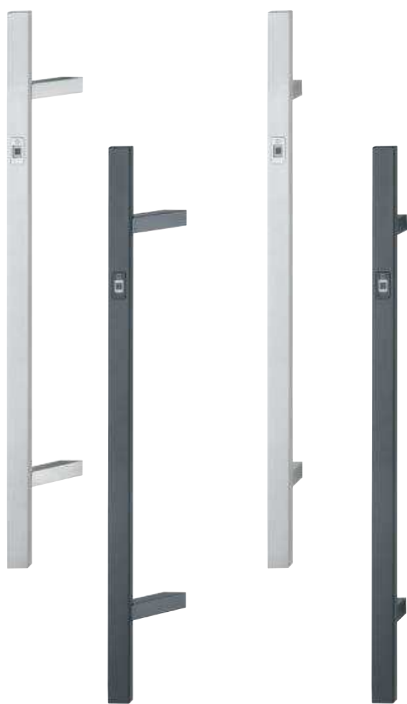
Poignées battantes rectangulaires (E5724BC, E5726BC )