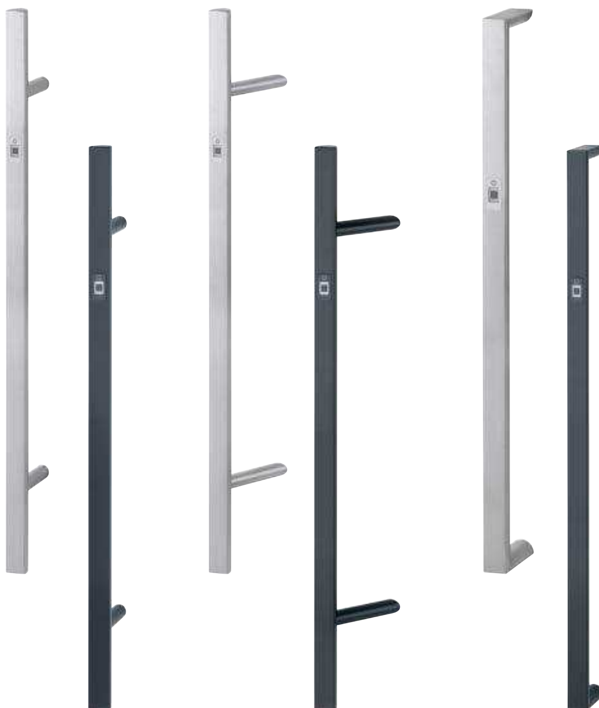
Poignées battantes avec section en D (E5091BC, E5092BC, E5095BC)