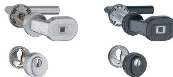
Garniture de sécurité sur rosaces avec bouton (E86GBC/42H/42NSB-ZA/42HS/1400 ES1/SK2)