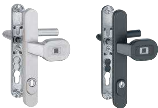
Garniture de sécurité sur plaques étroites avec bouton (E86GBC/3359ZA/3357N/1400F ES1/SK2)