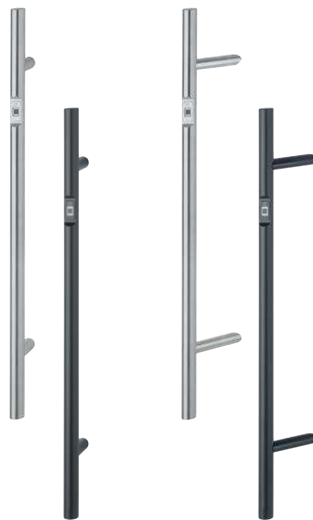
Poignées battantes design rond (E5061BC, E5062BC)