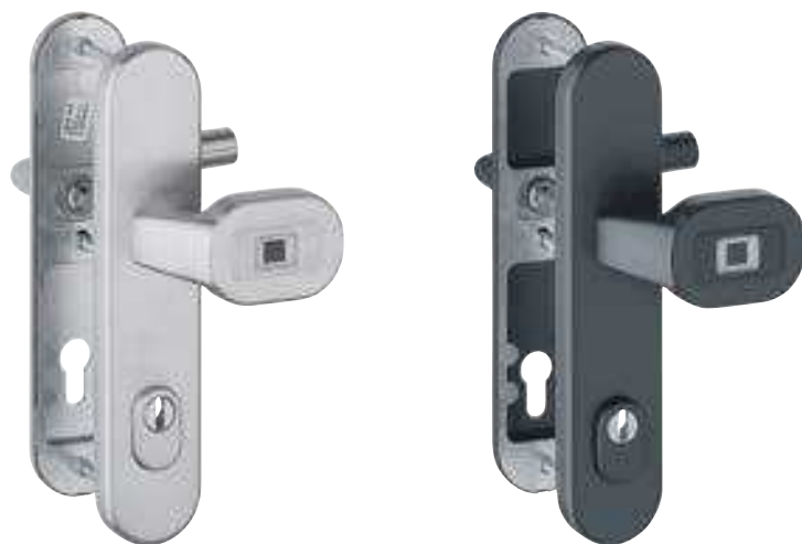
Garniture de sécurité sur plaques avec bouton (E86GBC/3332ZA/3310/1400F ES1/SK2)