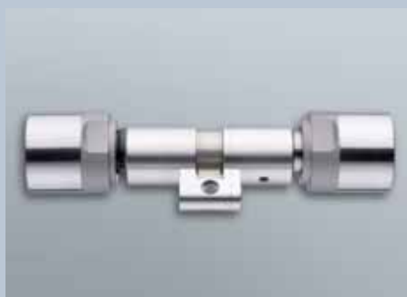
Cylindre confort profil suisse

Cylindre avec module électronique, conçu pour un montage dans les portes avec profil suisse. Il analyse les signaux radio des transpondeurs et valide ou non une autorisation d'accès.